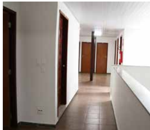
Terceiro pavimento com 8 quartos

O diretor Cláudio Utsch teve um cuidado especial com o andar térreo da casa por dois motivos: a sala, ampla, bem ventilada e com sofás e cadeiras confortáveis onde os hóspedes poderão receber visitas. Além disso, é no andar térreo que está situado o quarto para portador de necessidades especiais (PNE) com banheiro adaptado.