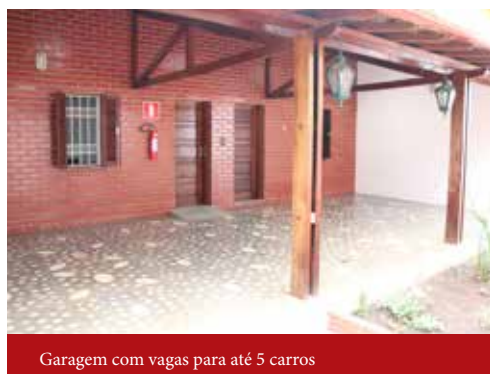
Garagem com vagas para até 5 carros