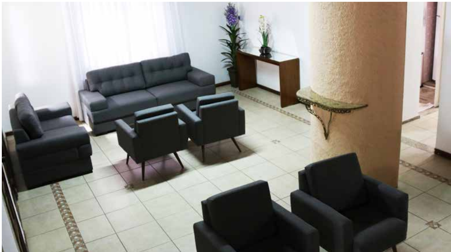
Recepção e sala ampla

O SINDPÚBLICOS-MG vai inaugurar no início do segundo semestre de 2017 sua Casa de Apoio, um local para receber os filiados que precisam se deslocar para Belo Horizonte para realizar exames, consultas médicas ou cirurgias.