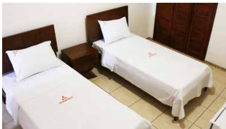
Suíte com duas camas de solteiro

A casa possui treze quartos que comportam confortavelmente trinta e três hóspedes. Além disso possui duas cozinhas – uma completa e outra de apoio - com fogão, geladeira, liquidificador, sandueira, micro-ondas, bebedouro e utensílios domésticos. A casa possui copa junto à cozinha para que os hóspedes possam preparar e degustar suas refeições.