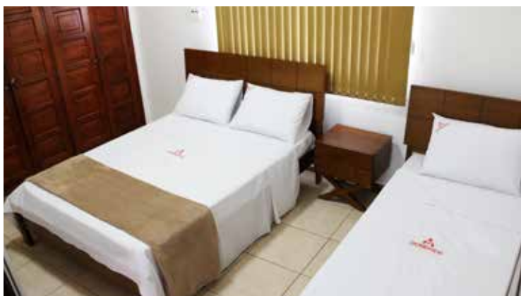
Suíte com cama de casal e uma cama de solteiro