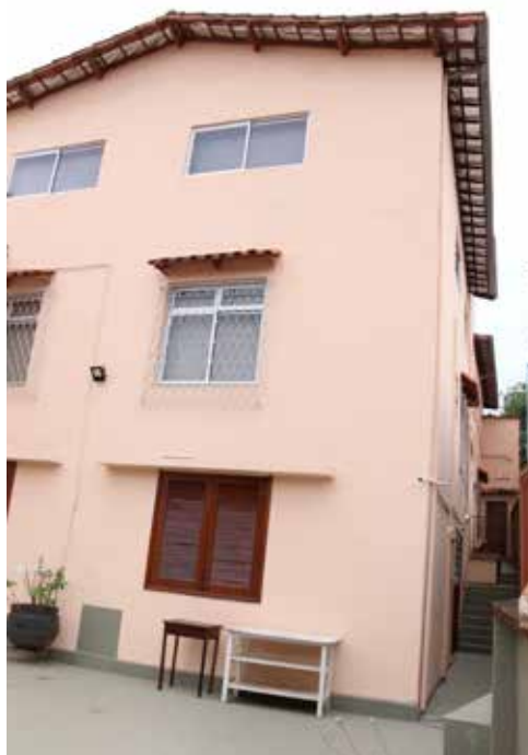
Área externa e quintal