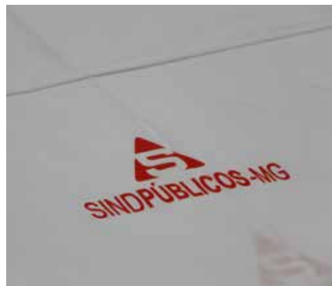
Jogo de lençol, fronha e manta