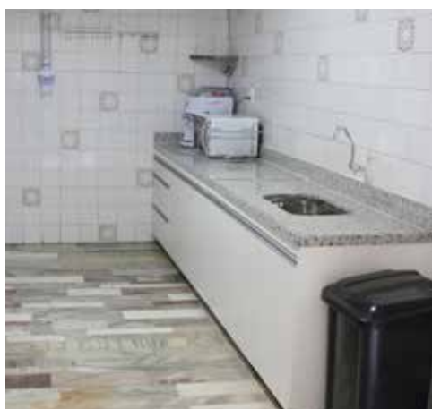
Uma das duas cozinhas

A localização da casa também é privilegiada, pois existe um comércio muito rico próximo ao local. Restaurantes, farmácia, café, banco, mercadinhos, supermercado, lotérica, agência dos Correios e Igreja. A Casa de Apoio está localizada na rua Eurita, a um quarteirão da Praça Santa Tereza (Praça Duque de Caxias).