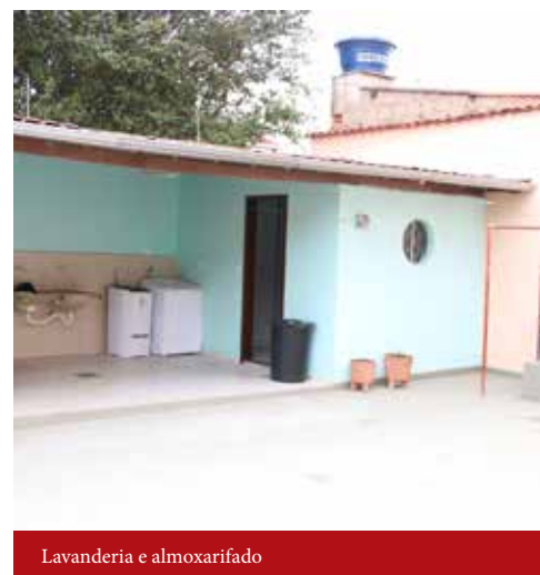
Lavanderia e almoxarifado

aliza exame, tratamento e consulta médica sem se preocupar com os valores exorbitantes pagos por hospedagem em hotéis”, afirmou o diretor.